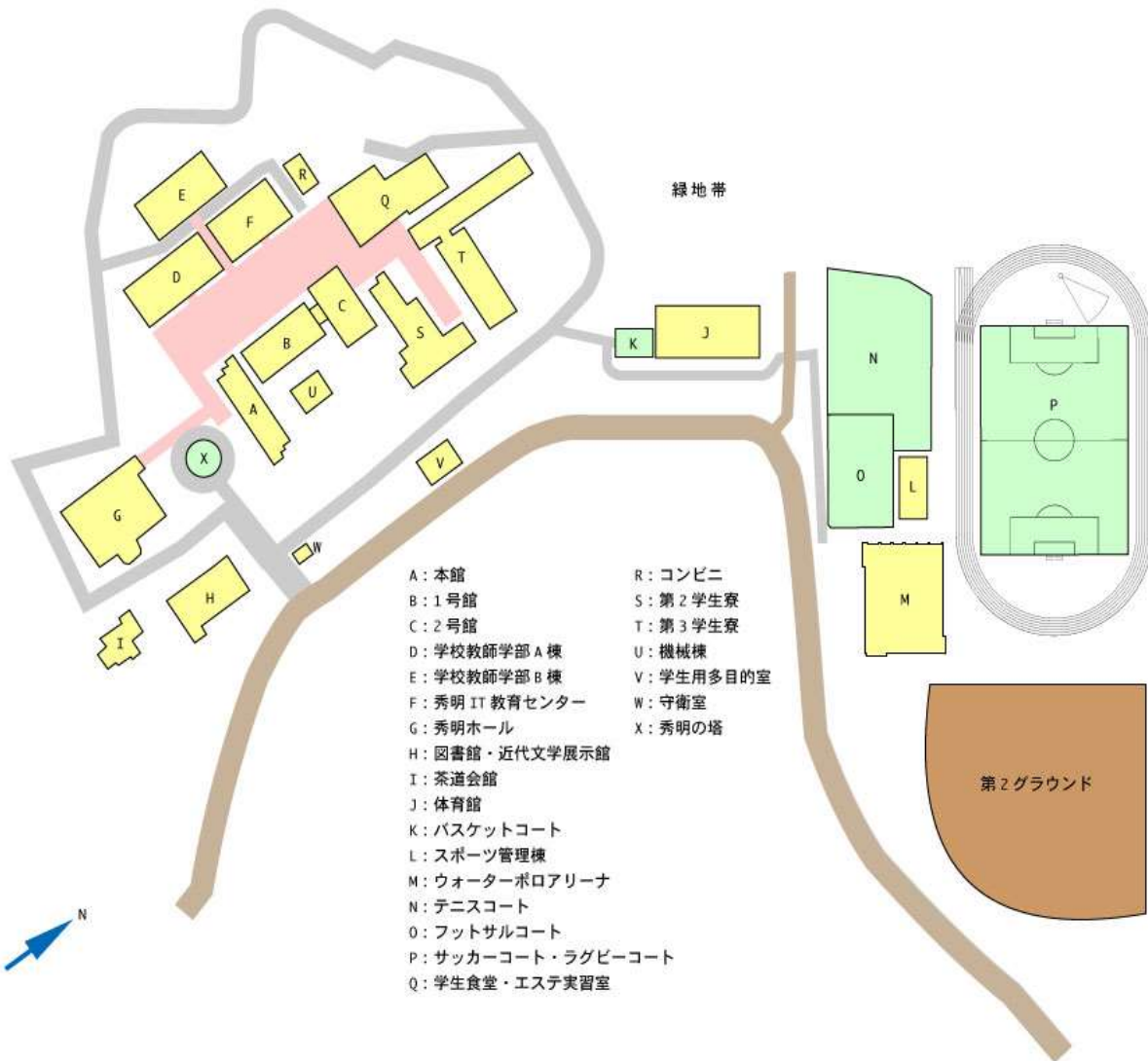
図 2-9-①-1 キャンパス配置図

校地校舎の面積は、次表（2-9-①-1）のとおりであり、設置基準を満たしている。