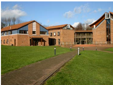
チョーサー・カレッジ・カンタベリー校

●英国のチョーサー・カレッジ・カンタベリー校と提携し、 留学制度を設け、学生の帰国後の学習活動に多大な効果을 上ている 点は高く評価できる。